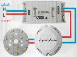
ربط متحكم أضواء بانتايس